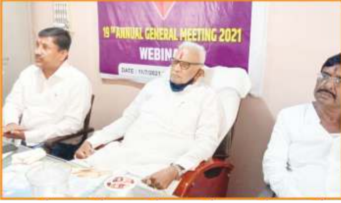
१९ वी वार्षिक सर्वसाधारण सभा ऑनलाईन झूम ॲपवर संपन्न झाली.