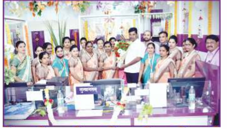
संस्थेच्या इचलकरंजी शाखा वर्धापन दिन प्रसंगी उपस्थित महिला, सभासद व कर्मचारी वर्ग