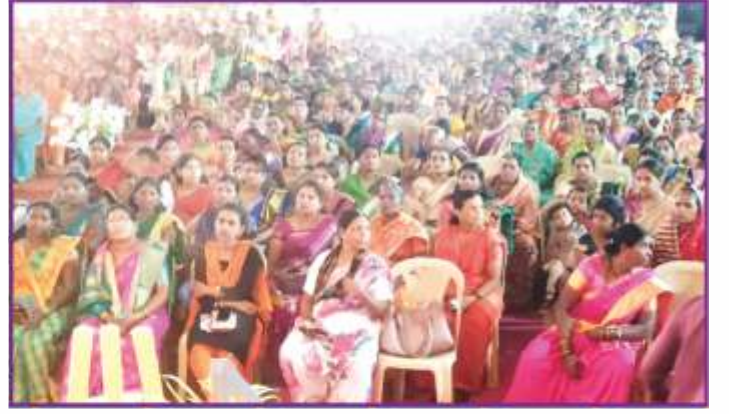
संस्थेच्या महिला बचतगट मेळावा व मशिनरी प्रदर्शन कार्यक्रमासाठी मोठ्यासंख्येने महिलांची उपस्थिती.