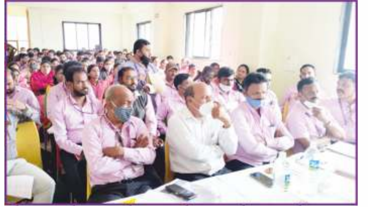
संस्थेने आयोजित केलेल्या कर्मचारी प्रशिक्षणास उपस्थित कर्मचारी वर्ग.