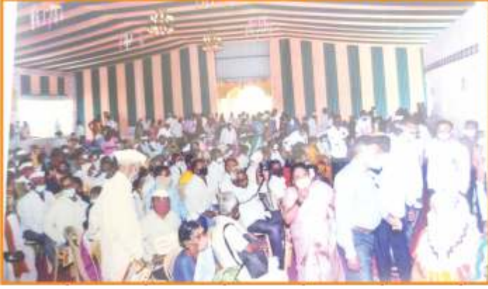
संस्थेने आयोजित केलेल्या महा आरोग्य शिबीरास संस्थेचे सभासद व लाभार्थी लाभ घेण्यासाठी मोठ्या संख्येने उपस्थित.